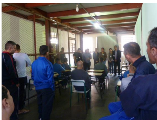
1º dia de Aula.