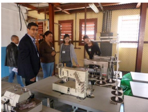
Sala de aula e máquinas.